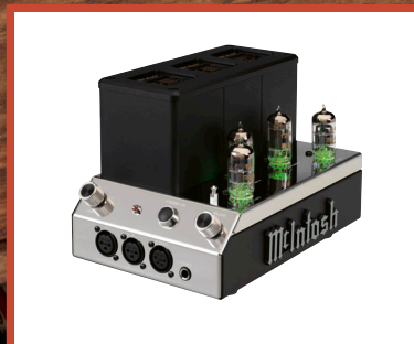
MCINTOSH Personalni high-end