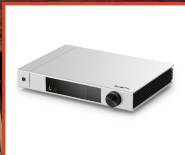
MATRIX AUDIO Bolji od najboljeg