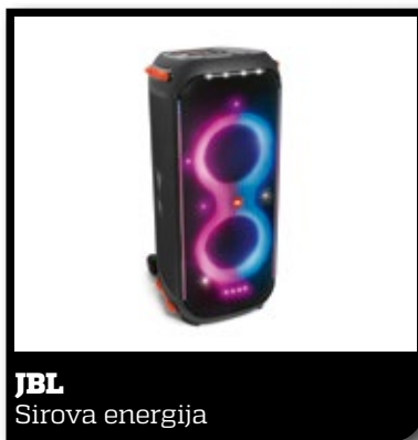
JBL Sirova energija