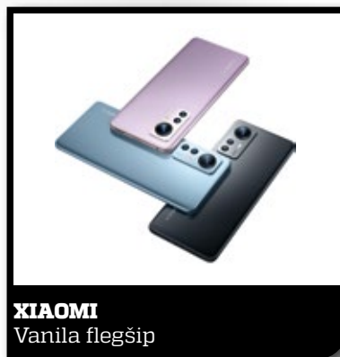
XIAOMI Vanila flegšip