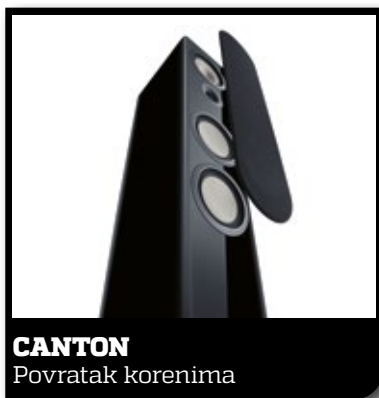
CANTON Povratak korenima