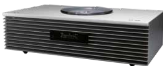
TECHNICS Bolji i pristupačniji