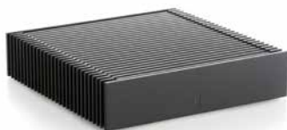
ROON NUCLEUS Prvoklasno rešenje