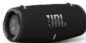
JBL Žurka u rancu